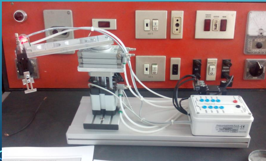
Braccio Elettropneumatico controllato da PLC