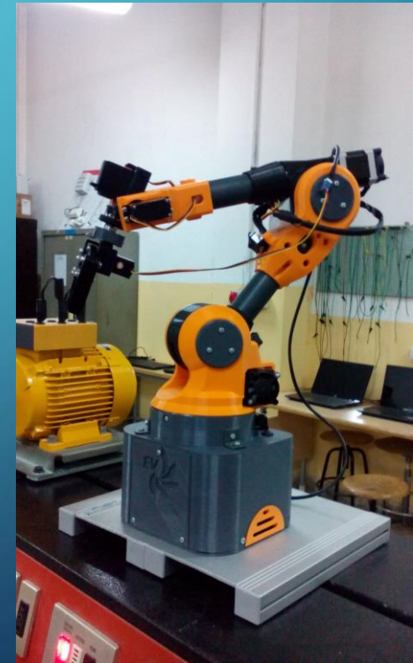
Braccio robotico, realizzato con stampante 3D, controllato da Scheda Elettronica Arduino