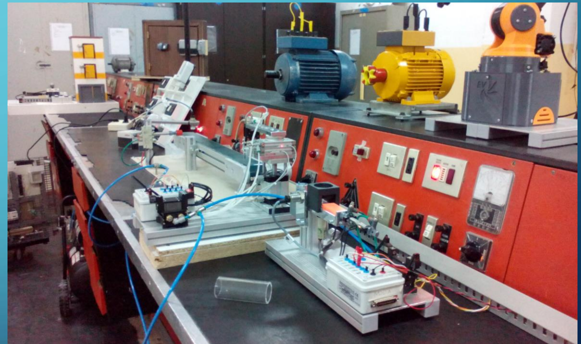
Laboratorio di T.P.S.E.E : Esercitazione con Braccio Eletto-pneumatico e nastro trasportatore controllato da PLC