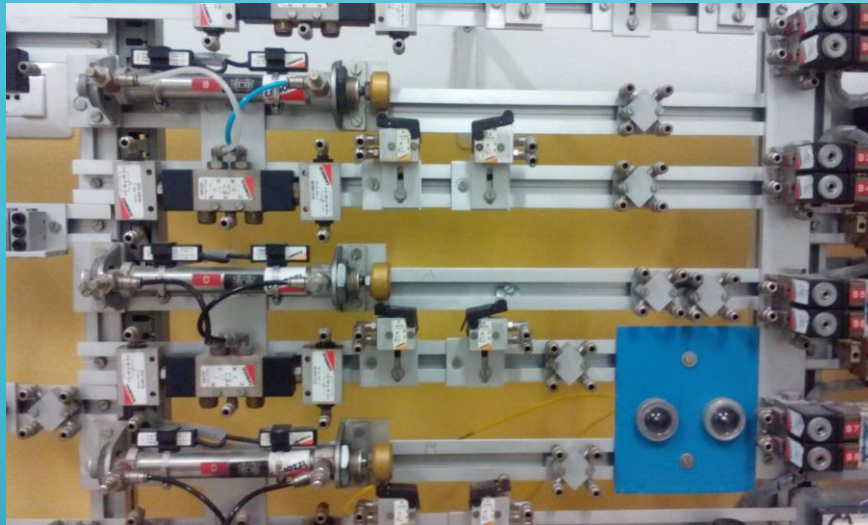
Pannello Pneumatico (Lab. Sistemi Automatici)