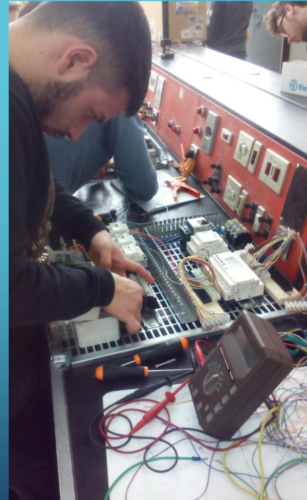
Cablaggio di un Quadro di Automazione Industriale con P.L.C (Controllore in Logica Programmabile)

Laboratorio di Elettronica ed Elettrotecnica: attrezzato di strumentazioni, macchine elettriche e banchi di lavoro per effettuare le misure elettriche ed elettroniche.